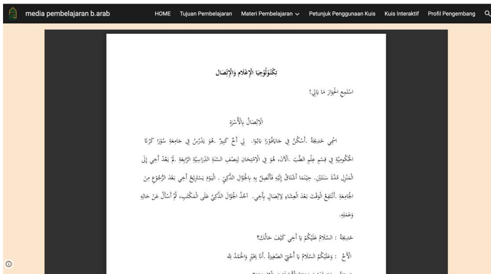
الصورة ٥ (المادة عن تكنولوجيا الإعلام والاتصال)