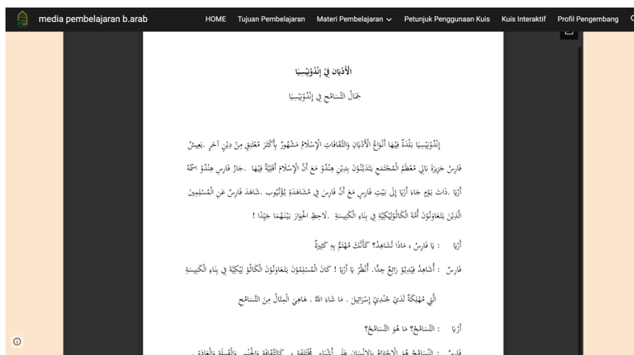
الصورة ٨ (النص عن الأديان في إندونيسيا)