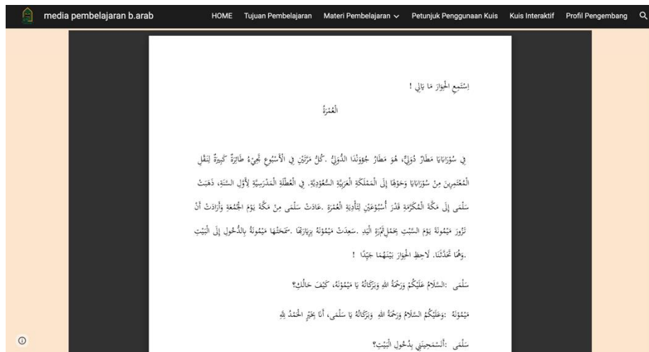
الصورة ٢ (النص عن الحج والعمرة)