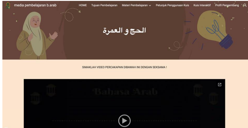
الصورة ١ (موقع "قويرا" في موضوع الحج والعمرة)