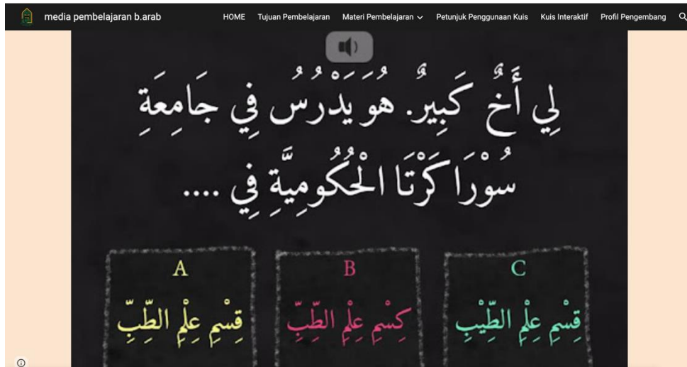
الصورة ٦ (موقع "قويرا" عن المسابقة والتدريب)