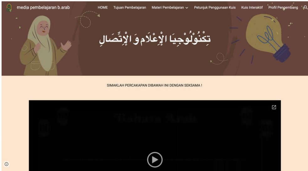
الصورة ٤ (موقع "قويرا" عن تكنولوجيا الإعلام والاتصال)